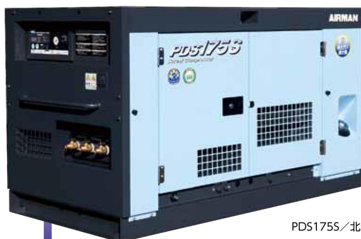
PDS175S / 北越工業株式会社