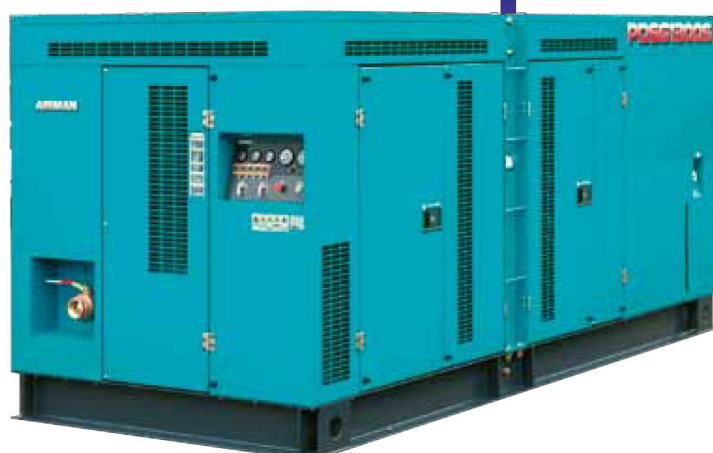
PDSG1300S / 北越工業株式会社