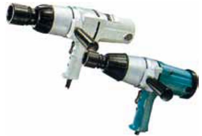
6906 6型/株式会社マキタ