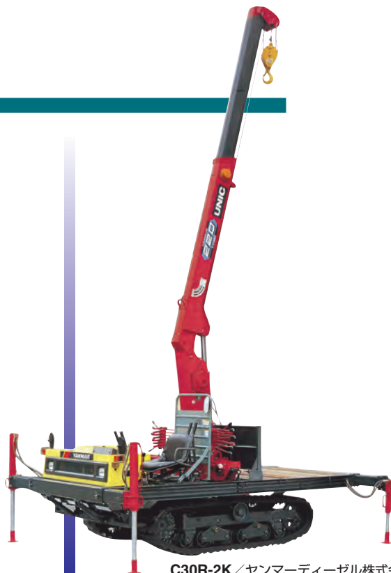
C30R-2K / ヤンマーディーゼル株式会社